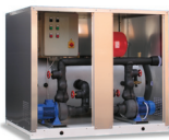
HPT. Gruppo accumulo inerziale accessorizzato