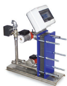
GSK. Gruppo di scambio termico

Ridurre al massimo le dispersioni di tempo resolvendo con un unico partner tutte le possibili problematiche di un impianto, installare prodotti di qualità certificata e tecnologia all'avanguardia, poter contare su una gamma completa di prodotti assolutamente compatibili tra loro, essere supportati dalla consulenza iniziale fino all'assistenza post-vendita: tutto questo rende prezioso il tuo lavoro...e Fiorini lo fa.