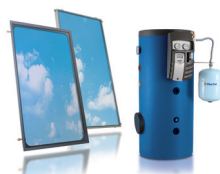
Linea solare termico