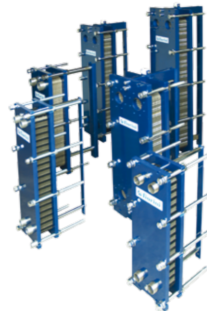
Plate heat exchangers, multipurpose heaters, DHW heaters for instantaneous and semi-instantaneous production, heat exchanger units, DHW storage units, and hot water storage systems also for the production of HTW, are just some of the Fiorini offers for heat exchange, heating and DHW production applications. All our products are made to the very highest qualitative standards, guaranteeing efficiency and reliability. Standard and tailored solutions available to meet the customer's specific requirements.