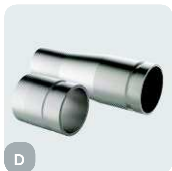
Соединение модифицировано из резьбового на фланцевое