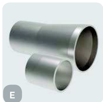
Соединение модифицировано из резьбового на Victaulic